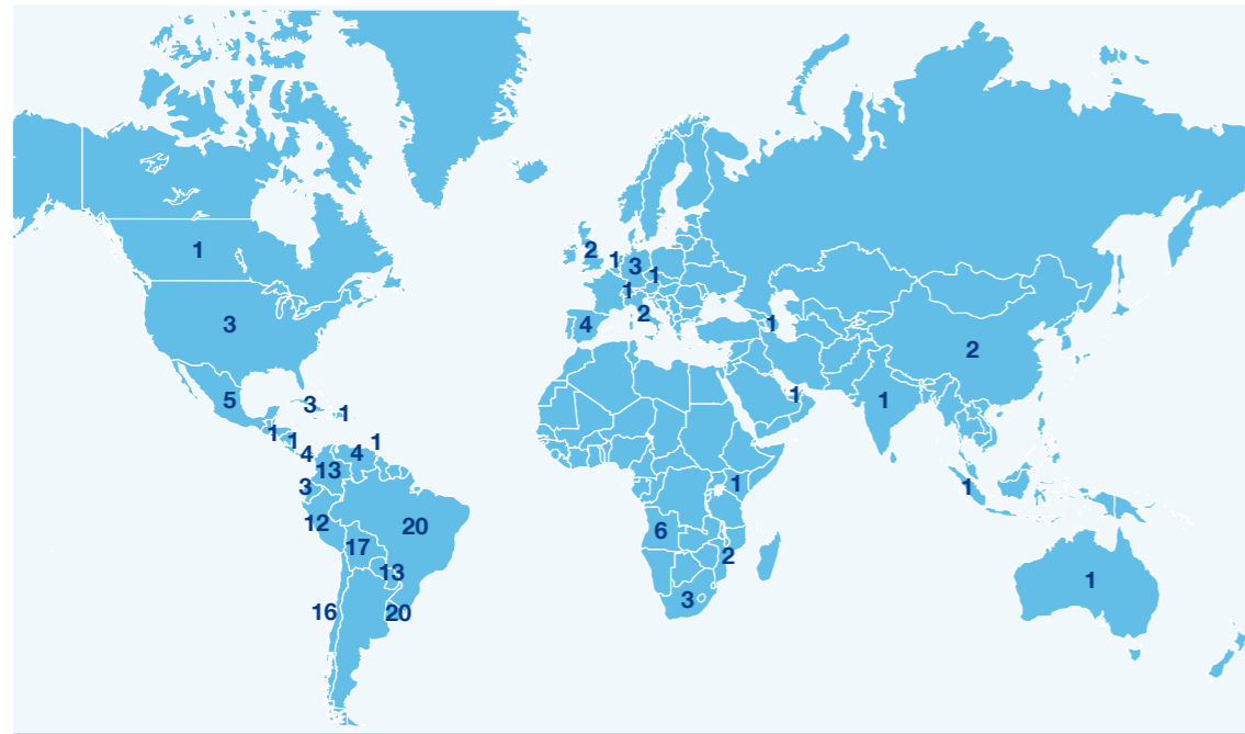
MAPA N° 1 PAÍSES DONDE LOS GRUPOS REALIZARON VISITAS DE VENTAS AL EXTERIOR Y SU FRECUENCIA