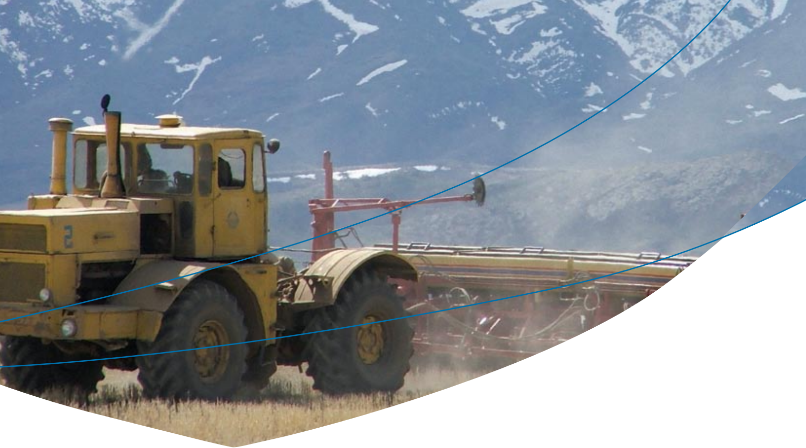
Maquinaria agrícola de Rosario, Santa Fe, trabajando en Kazajstán