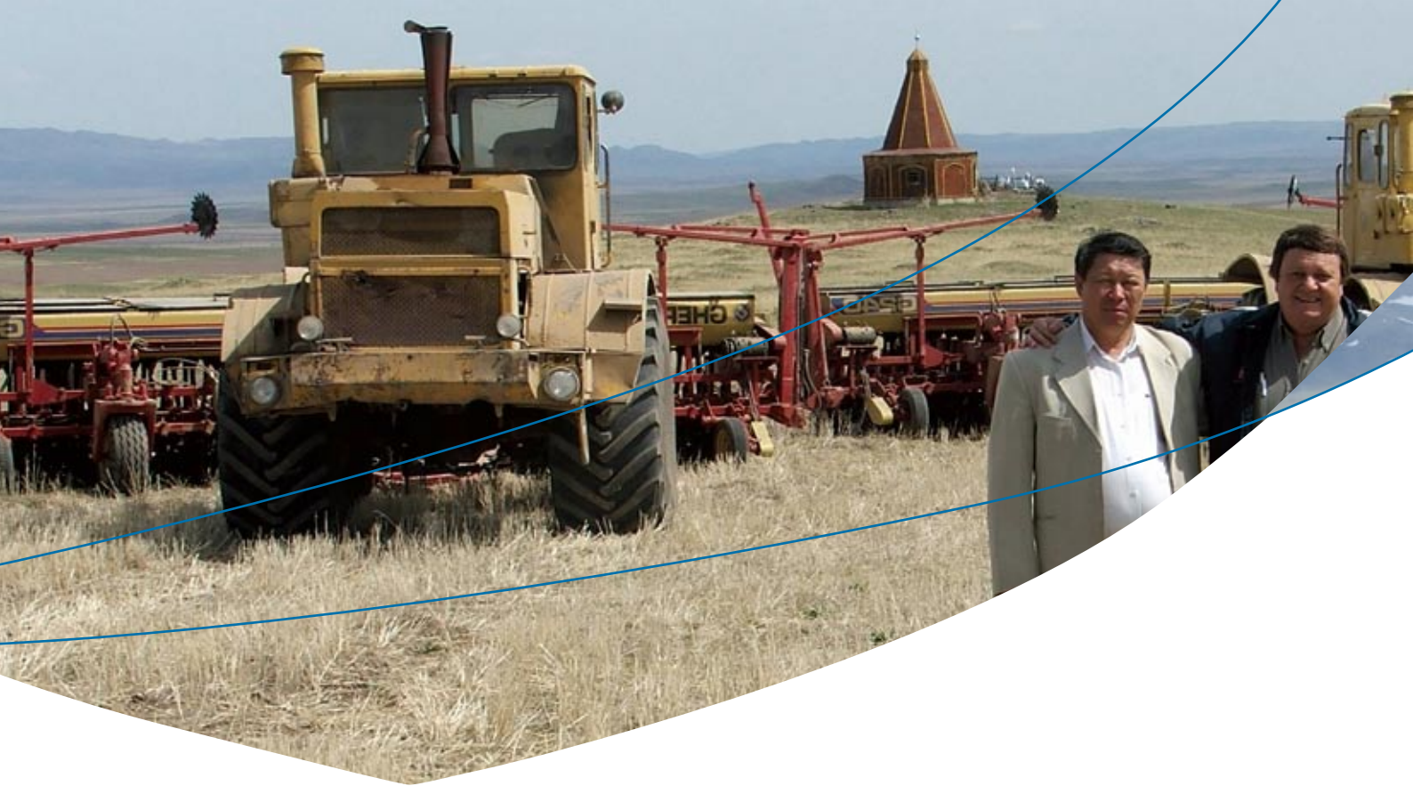
Maquinaria agrícola de Rosario, Santa Fe, trabajando en Kazajstan