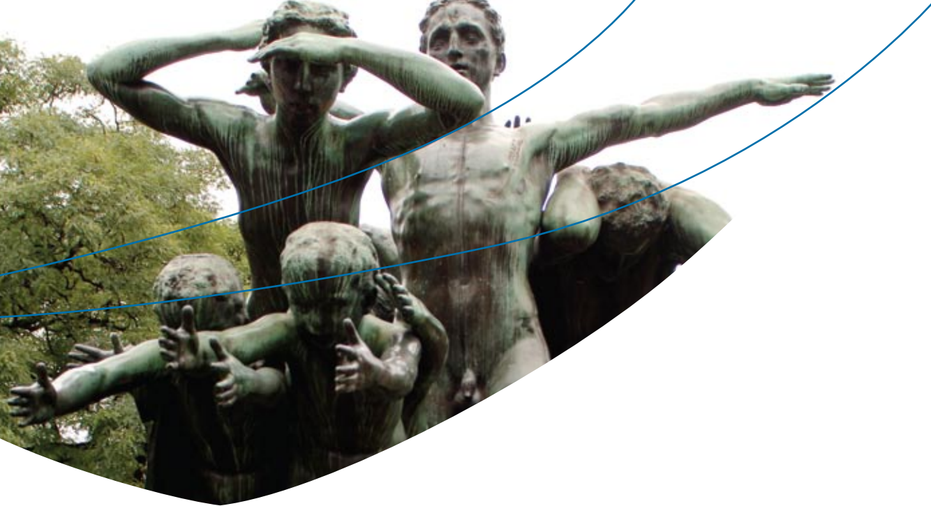
"Canto al trabajo" del escultor argentino Rogelio Yrurtia.