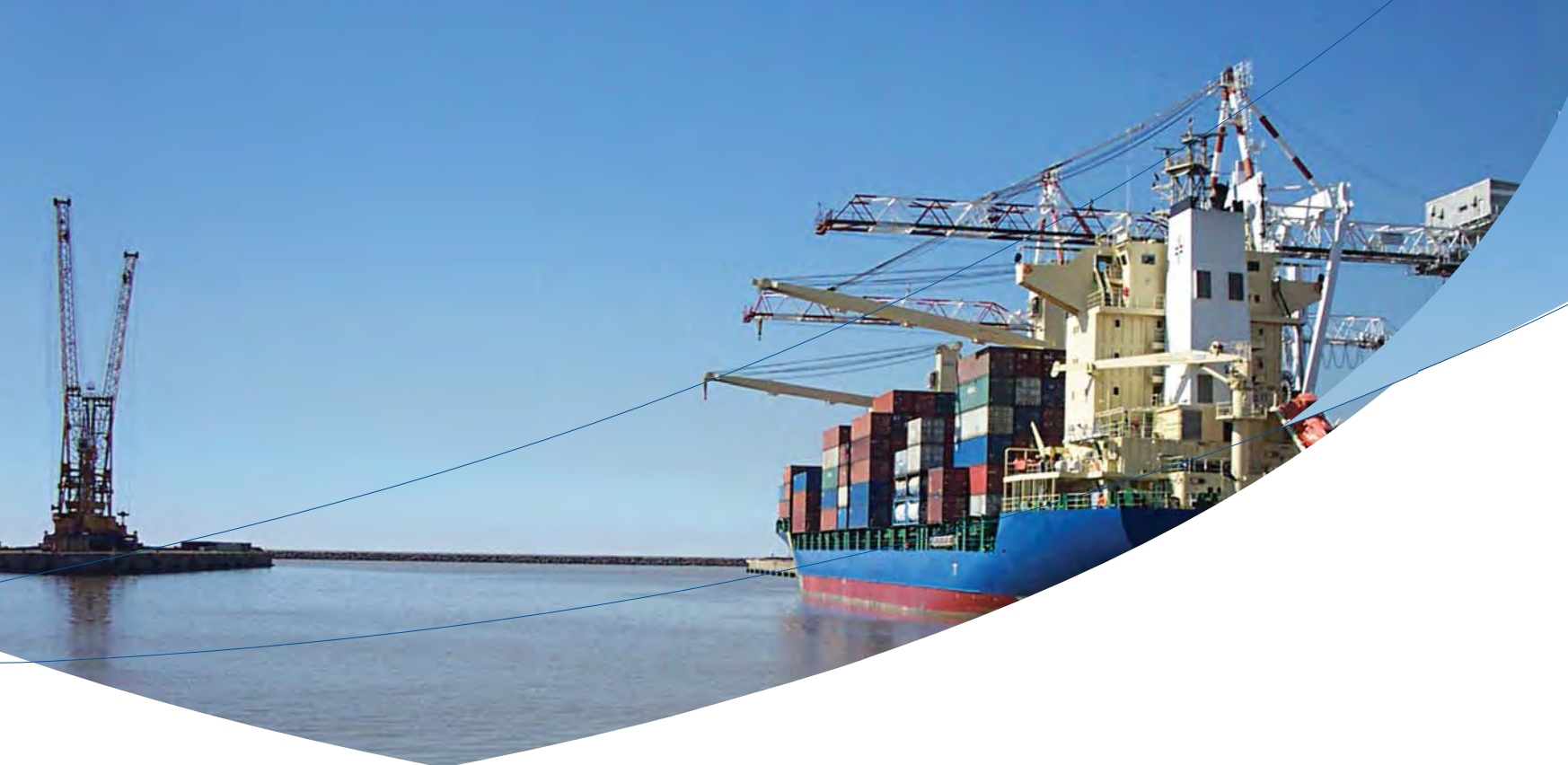
Puerto de Buenos Aires