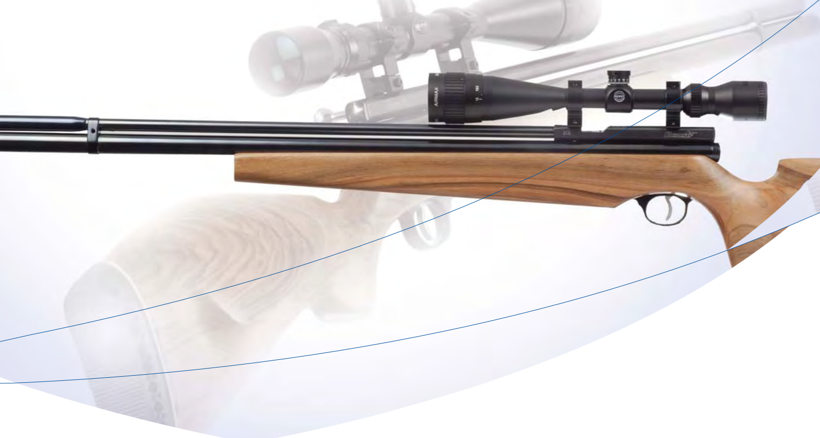
Armas neumáticas Menaldi